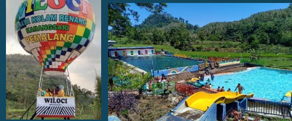
KOLAM RENANG WILOCI