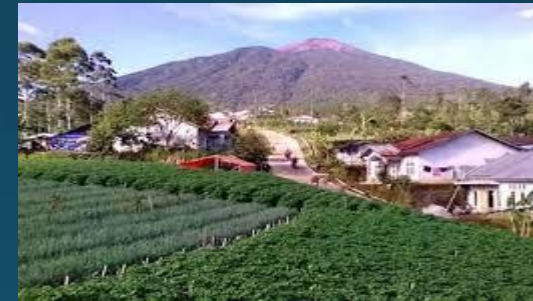
Rencana STA Pasar Sayur

APBDES 2021 : ± Rp. 750.000.000,- RKPDES 2022 : ± Rp. 500.000.000,-