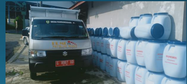
PENGELOLAAN SAMPAH TERPADU

APBDES 2021 : ± Rp. 581.000.000,- RKPDES 2022 : ± Rp. 500.000.000,-