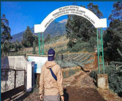
Jalur Pendakian Gunung Slamet